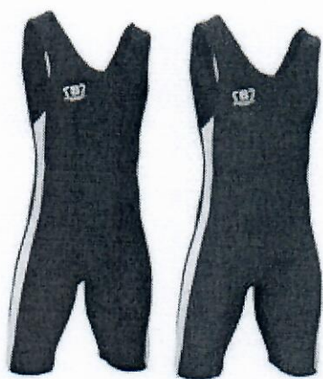
Berkner fighter rvački dres ( duo pack)