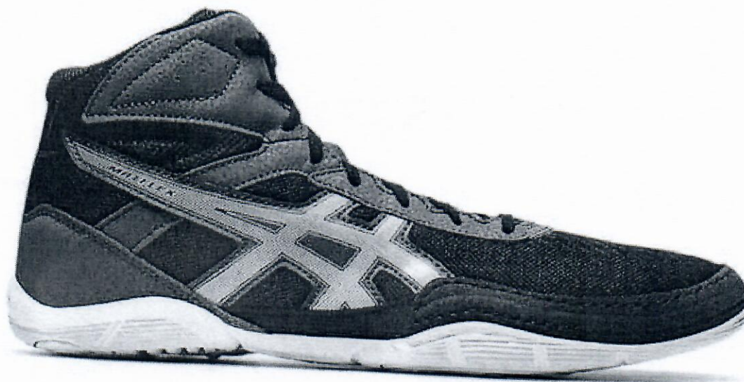
Asics matflex 6