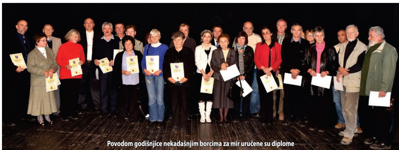
Povodom godišnjice nekadašnjim borcima za mir uručene su diplome

U nastavku svečanosti predsednik Skupštine uručio je diplome osobama koje su u protestima protiv nasilne mobilizacije od pre dvadeset godina imale važnu ulogu u borbama vođenim za mir. Nakon svečane sednice Skupštine opštine u pozorišnoj sali je održan okrugli sto sa učesnicima mirovnih demonstracija, koji su odgovarajući na pitanja novinarki Ibolje Gruik i Livije Tot pričali o tome kako su doživeli događaje od pre dvadeset godina, odnosno o tome kakav su uticaj oni imali na njihov potonji život.