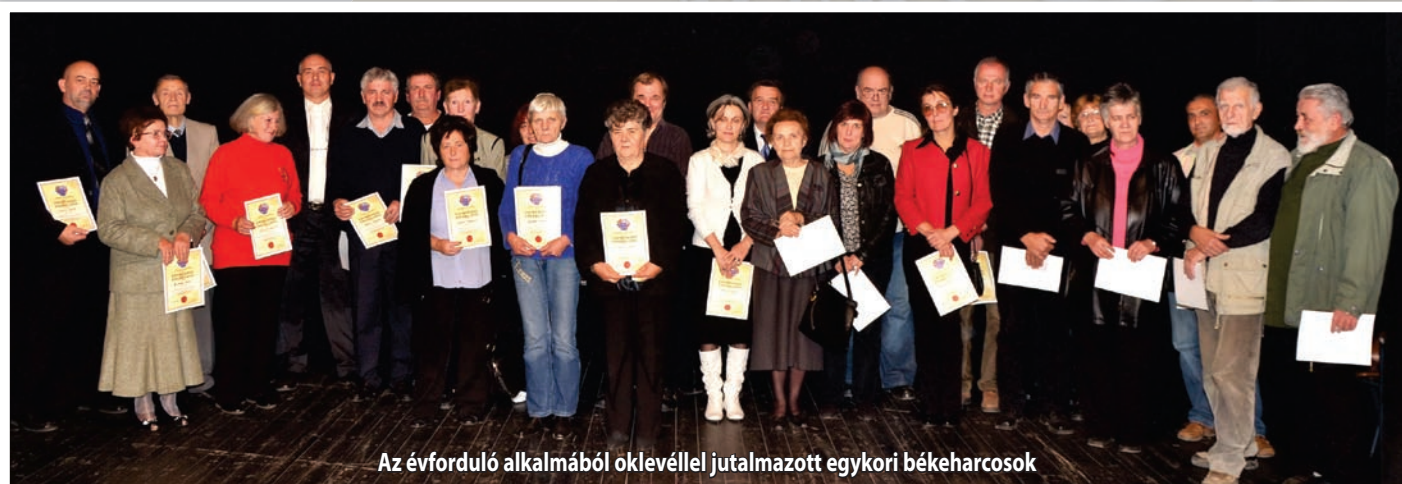
Az évforduló alkalmából oklevéllel jutalmazott egykori békeharcosok