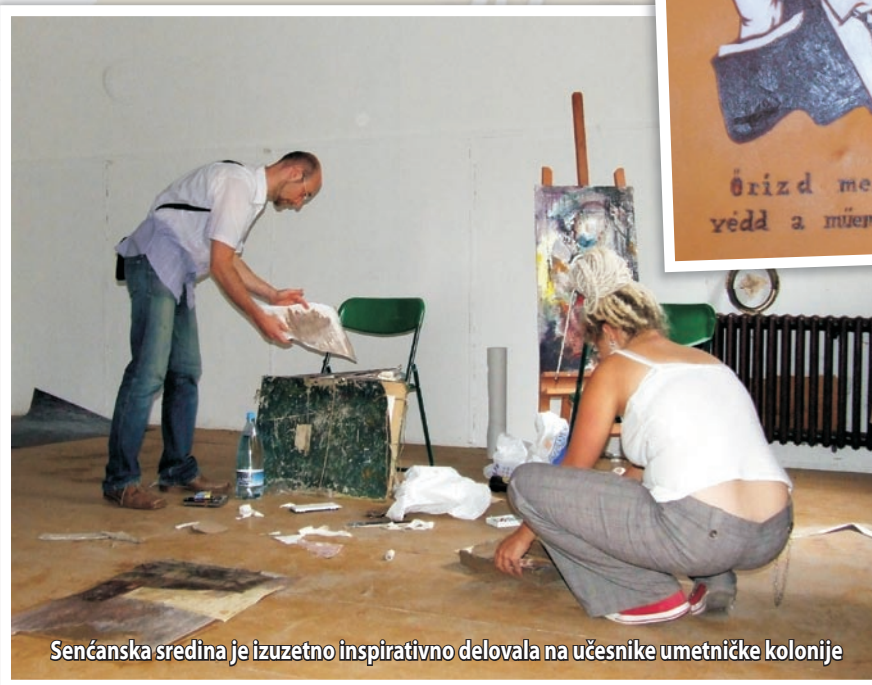
Senčanska sredina je izuzetno inspirativno delovala na učesnike umetničke kolonije

Saradnici Fakulteta umetnosti Univerziteta u Pečuju bi voleli ako bi senčanska umetnička kolonija mogla da postane tradicionalna, a mladi umetnici pak da se iz godine u godinu vraćaju u Sentu. Uzdaju se u to da niko nije uzео zlo to što su pokušali da jezikom umetnosti