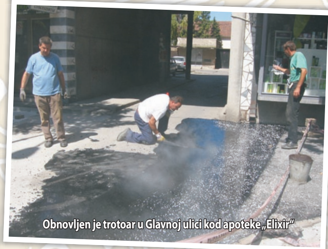
Obnovljen je trotoar u Glavnoj ulici kod apoteke „Elixir“