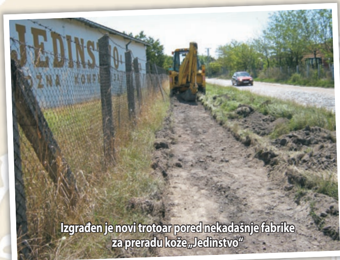
Izgrađen je novi trotoar pored nekadašnje fabrike za preradu kože „Jedinstvo“

Radovi na obnovi trotoara su na radost mnogih obuhvatili i odsek Glavne ulice kod apoteke „Elixir“, sektor Arpadove ulice počev od mosta koji vodi ka Čoki, pa gotovo do raskršća sa ulicom Svetozara Miletića, neparnu stranu Tornjoškog puta na potezu od železničke pruge do semafora na raskrsnici sa Gajevom ulicom, odnosno pojedine delove Poštanske ulice, ulice Jovana Đorđevića i Boška Jugovića. Pored ovoga, napravljen je i potpuno novi trotoar na odseku ulice Ištvana Hortija (pored nekadašnje fabrike za preradu kože „Jedinstvo“) između ulica Petefi brigade i Subotičkog puta, na kojem su ranije oni koji su saobraćali motornim vozilima mogli da koriste isključivo put prekriven lomljenim kamenom, a pešaci i biciklisti pak da saobraćaju samo po jednoj utabanoj stazi. Pored svega toga, trotoar za pešake je napravljen i na delu Subotičkog puta na kojem ranije uopšte nije bilo puta koji bi bio pogodan za kretanje pešaka. Nadležni u gradskom rukovodstvu se pouzdaju u to da će ovim radovima u znatnoj meri doprineti tome da se građani našeg grada još bolje osećaju u Senti.