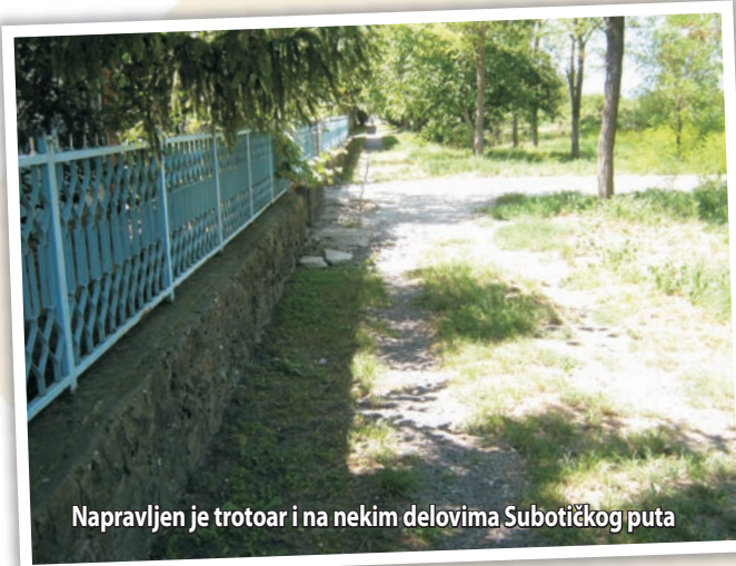
Napravljen je trotoar i na nekim delovima Subotičkog puta