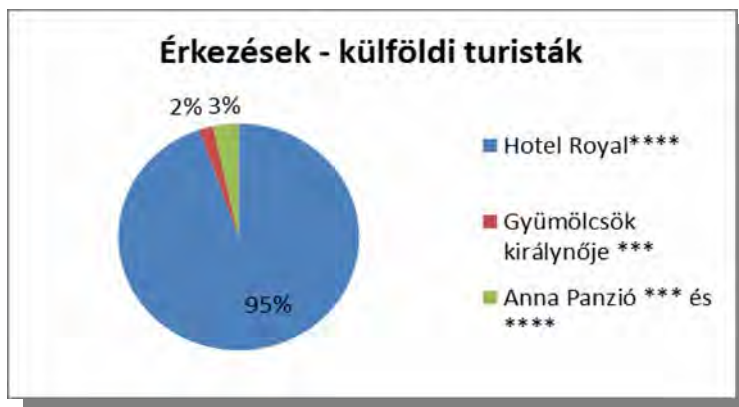
1. grafikon: A hazai és külföldi turisták érkezésének szálláshelyek szerinti megoszlása 2013-ban