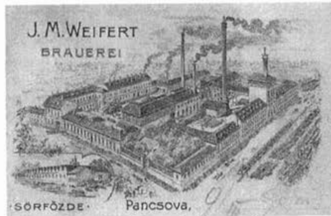
Пивара у најболијим годинама рада, у Време Вајферта (гравура коришћена као амблем на документима)

Услед раног почетка развоја индустрије, Јужни Банат је веома богат индустријским објектима који су веома стари. Како је развој индустрије настављен у континуитету до данас, на овој територији поред историјског развоја технологије и производње, можемо пратити и развој архитектуре индустријских објеката грађених у разним периодима, а који заједно чине индустријско наслеђе. Објекти индустријског наслеђа на територији Јужног Баната мога се сврстати у три групе: