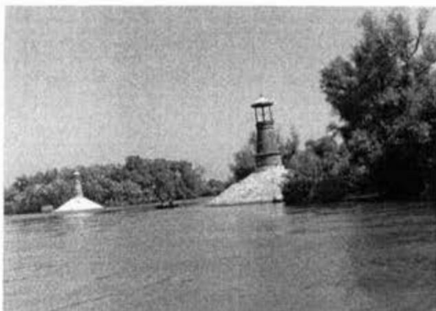
Светионици на ушћу Тамиша у Дунав

Аустроугарске владавине за потребе војске; железничке станице грађене као типски објекти у свим насељима кроз која је пролазила жељезница; аутобуске станице ; Лука на Дунаву у Панчеву.