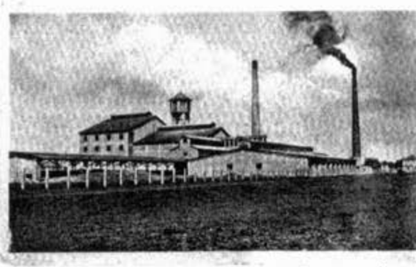
Стаклара у Панчеву-стара фотографија