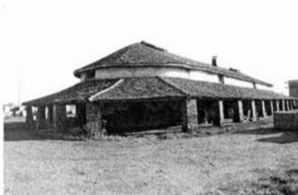
Циглана у Дебељачи