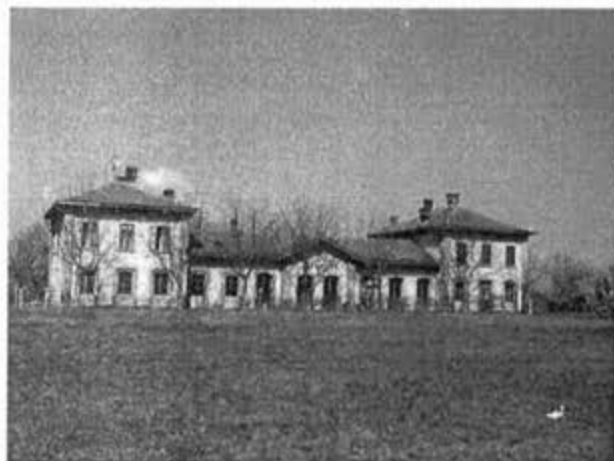
Железничка станица Јасеново