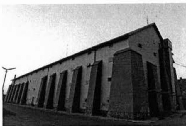
Црвени магацин у Панчеву