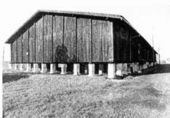
Дрвени магацин на железничкој станици у Ковачици