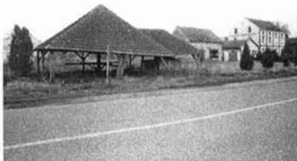
Бунари и млин у Владимировцу