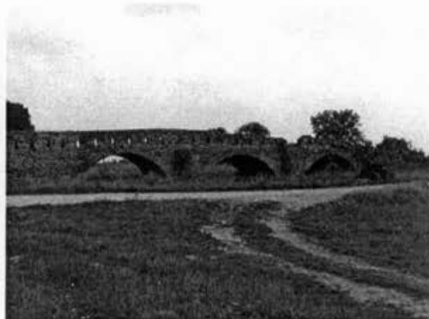
Стари мост у Пловици