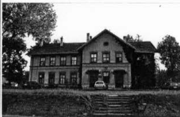
Железничка станица Тамиш у Панчеву