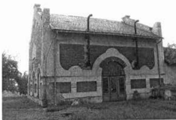
Црпна станица у Дубовцу